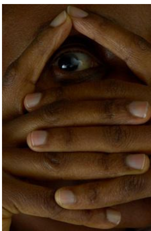
Exposition : Photo 1